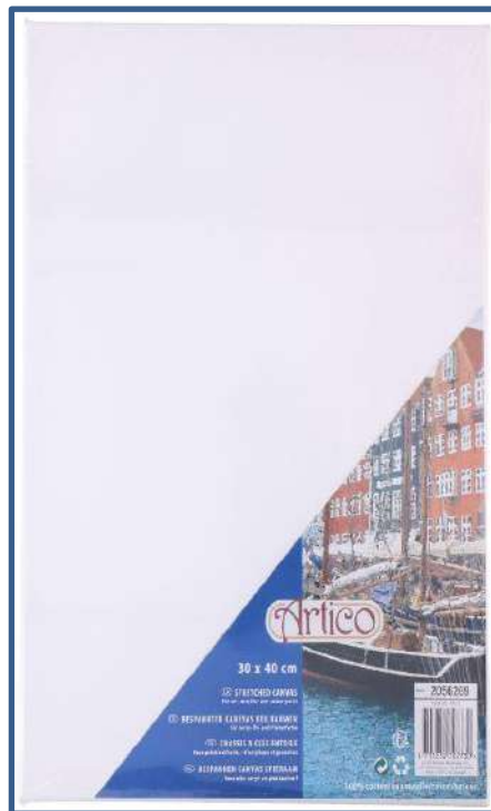
Foto des Artikels Picture of the item

Der Artikel wie beschrieben ist konform mit den einschlägigen Harmonisierungsrechtsvorschriften der Union: