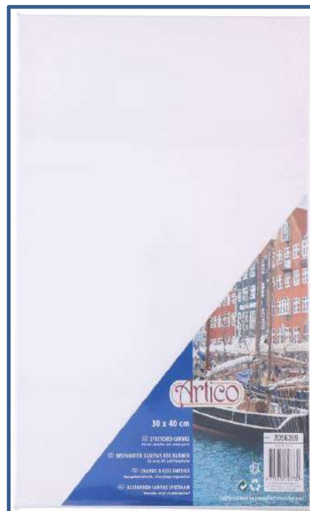
Foto van het artikel Picture of the item

Het beschreven voorwerp is in overeenkomst met de desbetreffende harmonisatiewetgeving van de Unie: