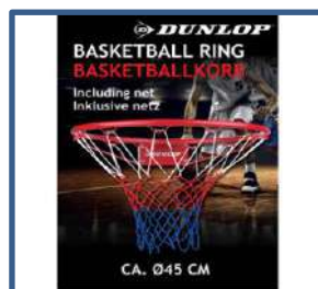
Photo de l'article Picture of the item

L'objet de la déclaration décrit ci-dessus est conforme à la législation d'harmonisation de l'Union applicable: The described object of the declaration is in conformity with the relevant Union harmonisation legislation: