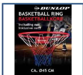
Foto van het artikel Picture of the item

Het beschreven voorwerp is in overeenkomst met de desbetreffende harmonisatiewetgeving van de Unie: