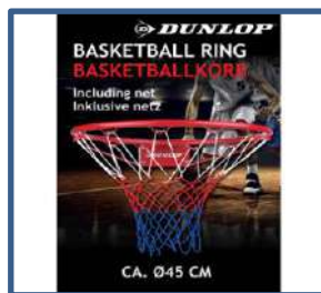
Foto des Artikels Picture of the item

Der Artikel wie beschrieben ist konform mit den einschlägigen Harmonisierungsrechtsvorschriften der Union: The described object of the declaration is in conformity with the relevant Union harmonisation legislation: