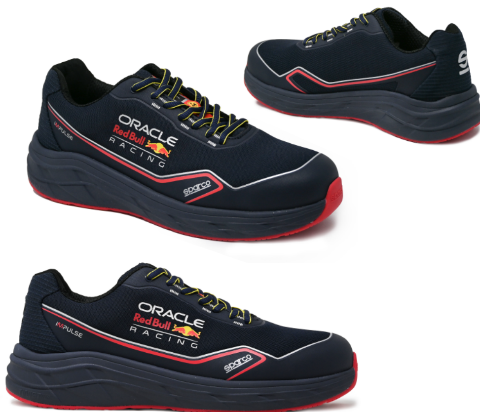
MILTON ESD SIPS SR FO HRO 07545RBtgBM