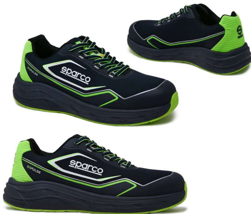
WILLEN ESD S1PS SR FO HRO 07545tgBMVF