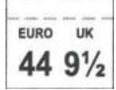
ETIQUETA DE TAMAÑO cosido entre la parte superior y la lengüeta Dim 17 x 14 mm