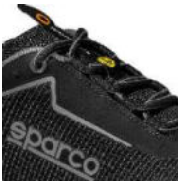
Etiqueta TEAMWORK en tejido jacquard en la lengüeta, Logotipo ESD en las trabillas de los cordones.