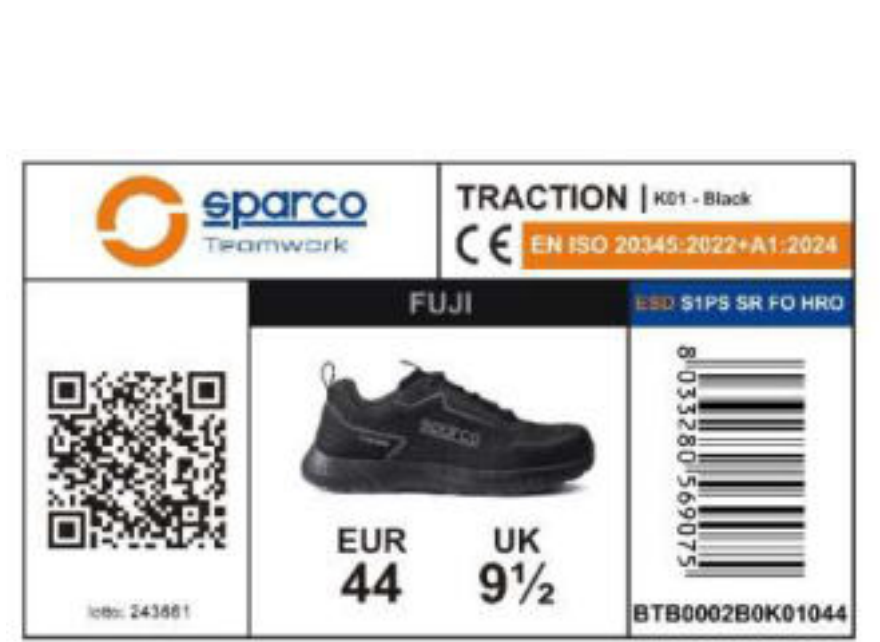
ZAPATERO SPARCO TEAMWORK BICOLOR en cartón Papel de seda interior azul-naranja y protector. Indicaciones de reciclaje válidas para ITALIA en la parte inferior (PAP20)