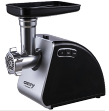
MEAT MINCER CR 4812