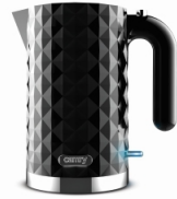
Electric Kettle CR 1169