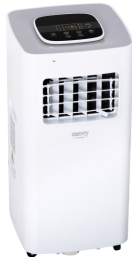
AIR CONDITIONER CR 7926