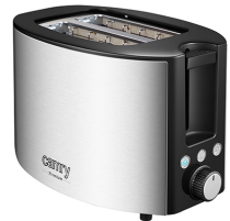
TOASTER 2 SLICES CR 3215