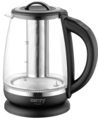
ELECTRIC KETTLE CR 1290