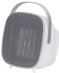
CERAMIC FAN HEATER CR 7732