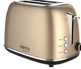
TOASTER 2 SLICES CR 3217