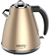
ELECTRIC KETTLE CR 1292