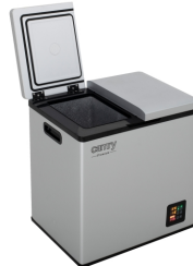
PORTABLE FRIDGE CR 8076