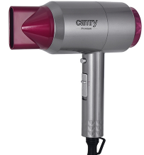
HAIR DRYER CR 2256