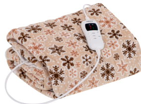
HEATING UNDERBLANKET CR 7430