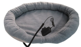
HEATED ANIMAL DEN CR 7431