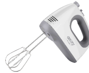
MIXER CR 4220