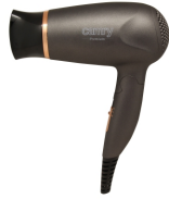
HAIR DRYER CR 2261