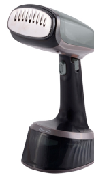
GARMENT STEAMER CR 5033