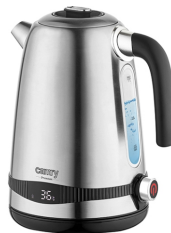
ELECTRIC KETTLE CR 1291