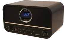
RETRO RADIO CR 1182