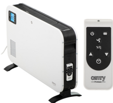
CONVECTION HEATER CR 7724