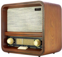
RETRO RADIO CR 1188