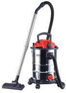
VACUUM CLEANER CR 7045