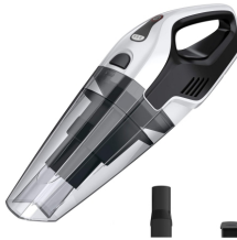
BAGLESS VACUUM CLEANER CR 7046