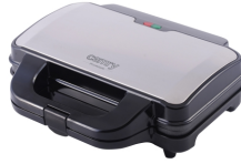
SANDWICH MAKER CR 3054