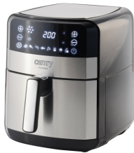
AIR FRYER OVEN CR 6311