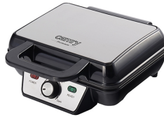
WAFFLE MAKER CR 3046