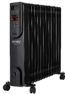
OIL FILLED RADIATOR CR 7814