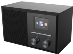
INTERNET RADIO CR 1180