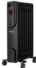
OIL FILLED RADIATOR CR 7812