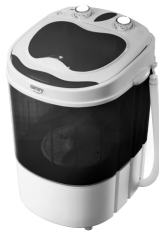
WASHING MACHINE CR 8054