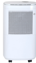
AIR DEHUMIDIFIER CR 7851