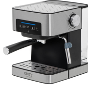
ESPRESSO MACHINE CR 4410