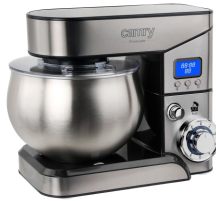
FOOD PROCESSOR CR 4223