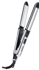
HAIR STRAIGHTENER CR 2320