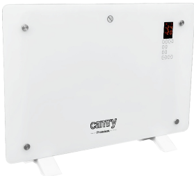
GLASS HEATER CR 7721