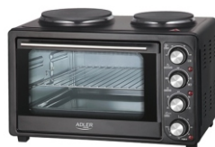
Electric Oven With HOB AD 6020