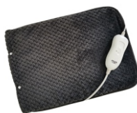
HEATED PAD AD 7433