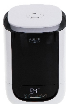
AIR HUMIDIFIER AD 7966