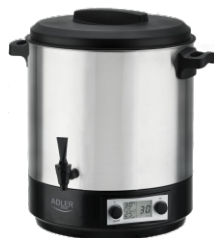
PASTEURIZATION POT AD 4496