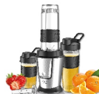
PERSONAL BLENDER AD 4081