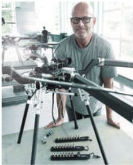
Las "Belts" de Wera