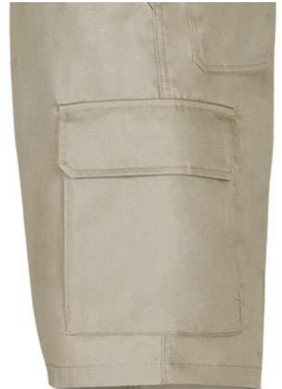
Detalle bolsillo lateral