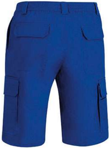
Vista parte trasera de la prenda