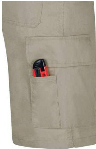
Detalle bolsillo lateral con departamento para cutter